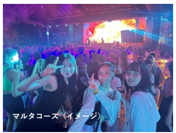
マルタコース（イメージ）

【起床】 時間になったら自分で起きて、ベッドメイキングから1日が始まります！3日に一回程度のペースでクリーナーが清掃が入ります。