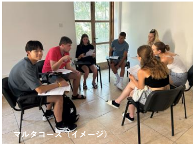
マルタコース（イメージ）

【起床】 時間になったら自分で起きて、ベッドメイキングから1日が始まります！3日に一回程度のペースでクリーナーが清掃が入ります。