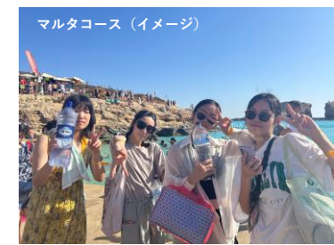
マルタコース（イメージ）