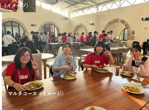
マルタコース（イメージ）