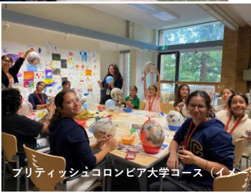
ブリティッシュコロニア大学コース（イメージ）