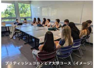
ブリティッシュコロニア大学コース（イメージ）

午後（または午前）に、他国の留学生（またはISSグループのみ）と様々なアクティビティに参加します。広いキャンパス内でのアクティビティや郊外にでかけての観光など、コースによって様々なプログラムがございます。スポーツで体を動かしながら交流したり、ペインティングでたのしんだり、博物館や美術館、また有名な観光地でショッピングに挑戦したり、海外ならではの経験を楽しみながら、生きた英語に触れていきます！