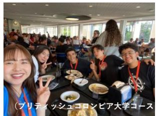
（ブリティッシュコロニア大学コース（イメージ））

寮やキャンパス内の食堂でビュッフェスタイルで提供されることが多いです。校外へ遠足に出かけるときはパックランチが用意されますのでそちらを持って行きます。コースによってはキャンパス内にドラッグストアがあったり、カフェで軽食が購入出来るたりもします。