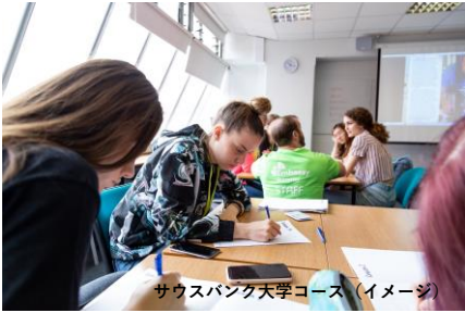
サウスバンク大学コース（イメージ）