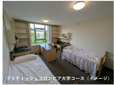
ブリティッシュコロニア大学コース（イメージ）