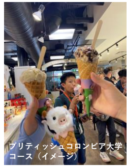
ブリティッシュコロニア大学コース（イメージ）

午前（または午後）に、他国の留学生と一緒に英語レッスンを受けます。1クラス10~20名程度でクラスは事前のレベル分けテストにて適したクラスに分けられます。