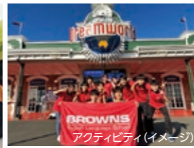
アクティビティ(イメージ)