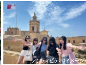
アクティビティ(イメージ)