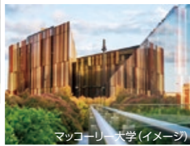
マクコーリー大学(イメージ)