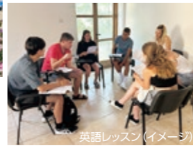
英語レッスン(イメージ)