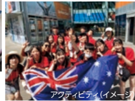
アクティビティ(イメージ)