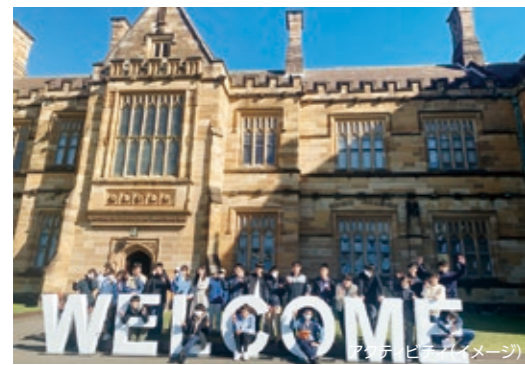
ウェルカム(イメージ)