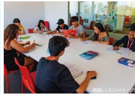
英語レッスン(イメージ)