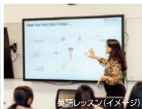
英語レッスン(イメージ)