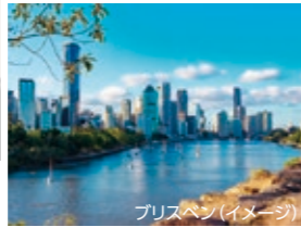
ブリスベン(イメージ)